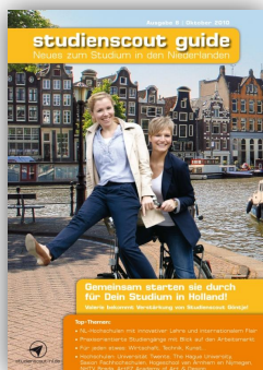
Studienscout Guide (gedrukt)

Mix van activiteiten Verschillende kanalen die de doelgroep bereiken