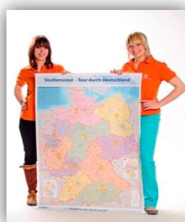
Studienscout Voorlichtingstoer door Duitsland