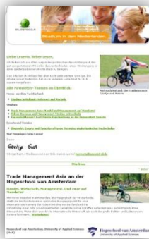
Studienscout Online Nieuwsbrieven